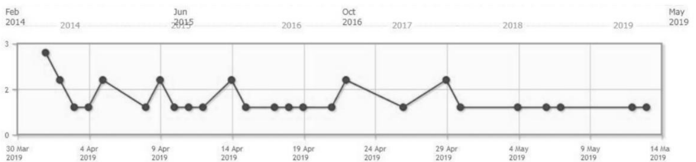
Застапеност на говор на омраза според временски период

Најголем број на верификувани случаи се однесуваа на говор на омраза поради етничка припадност (31% од вкупниот број на пријави), говор на омраза поради политичка припадност и поради пол и род (со по 21% од вкупниот број на пријави) и 14 пријави на говор на омраза поради сексуална ориентација и родов идентитет (16%). Како што може да се забележи од хистграмскиот преглед на пристигнати пријави за говор на омраза, најголем дел се регистрирани за време на политичката кампања. По завршувањето на претседателските избори се забележува драстично намален број на пријави за говор на омраза.